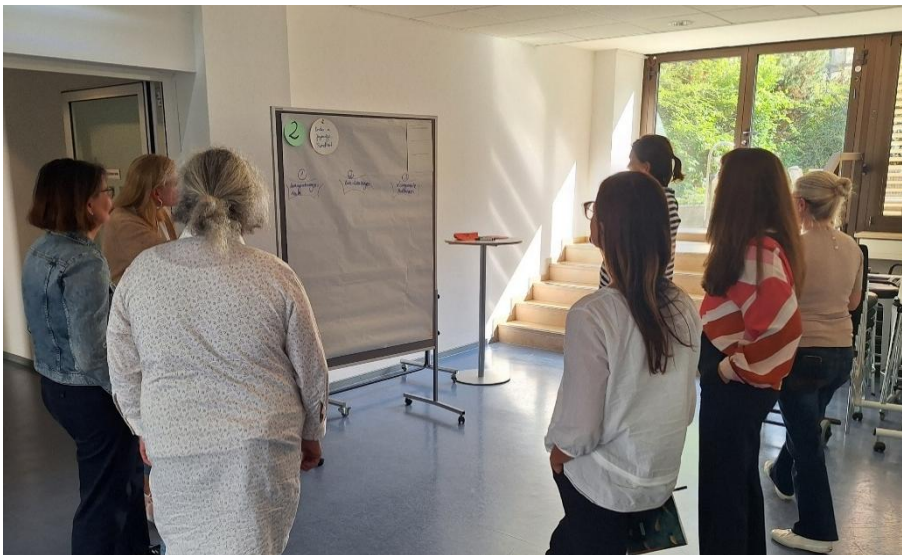
Workshop Fachleitlinie Gesundheit im AK Gesundheitsförderung und Prävention des Gesundheitsbeirats im September 2024

Weitere Informationen zur Fachleitlinie und zum Öffentlichkeitsbericht sind verfügbar unter: www.stadt.muenchen.de . Bei Rückfragen erreichen Sie das Team unter leitlinie.gsr@muenchen.de .