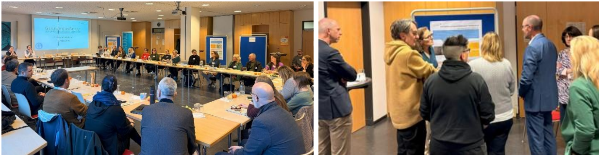
Diskussion und Austausch im Gesundheitsforum, Bildquelle: Gesundheitsbeirat

Der Gesundheitsbeirat möchte die Gesundheitskonferenz am 17. Juni zum Thema „Gesundheit in München – Prävention gemeinsam gestalten“ und den landesweiten Präventionstag am 12. Oktober nutzen, um das Thema Prävention stadtweit in den Fokus zu rücken. Die Mitglieder des Gesundheitsbeirats brachten zahlreiche Vorschläge zu Maßnahmen und Gestaltungsmöglichkeiten für den Präventionstag ein.