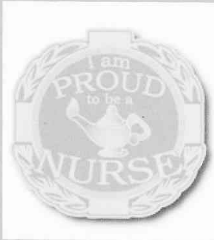
Nurses Association of Botswana, Kampagne 2011